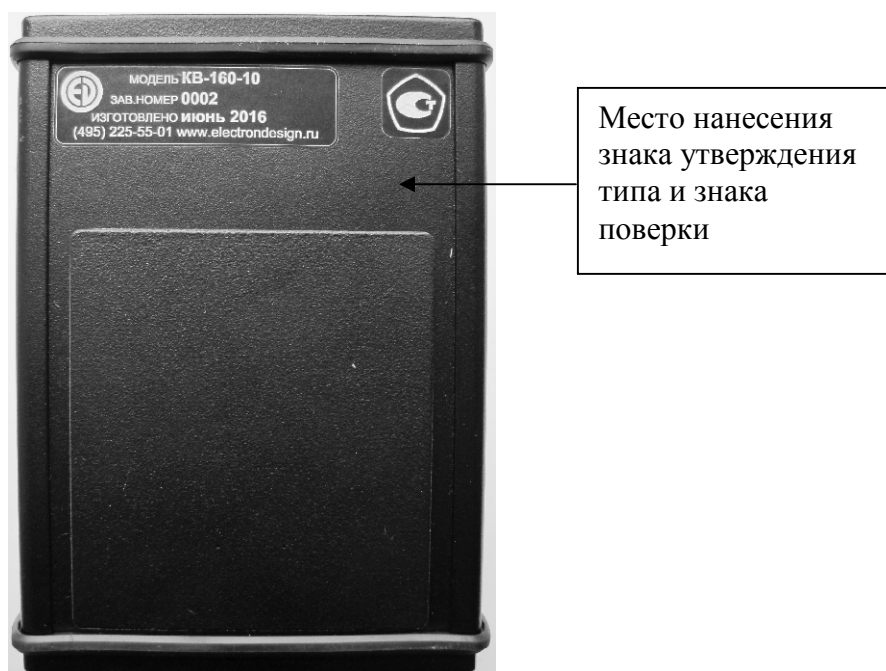
Рисунок 2 - Нижняя панель устройств воспроизведения вибрации KV-160