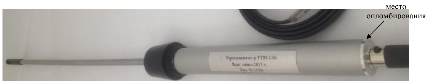
Рисунок 6. Модификация ТТМ-2-04, исполнение ТТМ-2-04-О