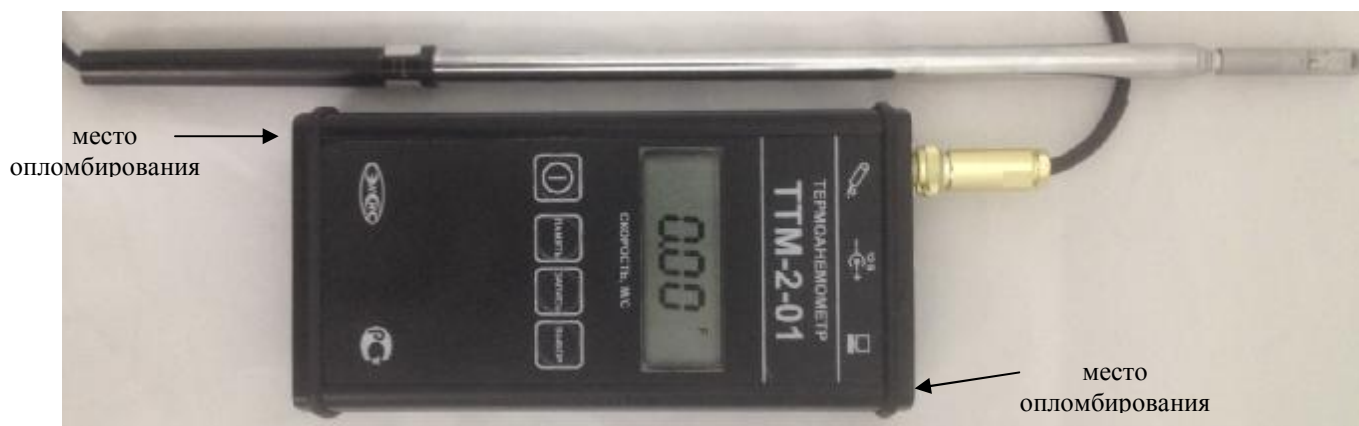
Рисунок 1. Модификация ТТМ-2-01