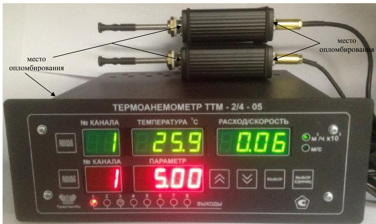
Рисунок 7. Модификация ТТМ-2/4-05