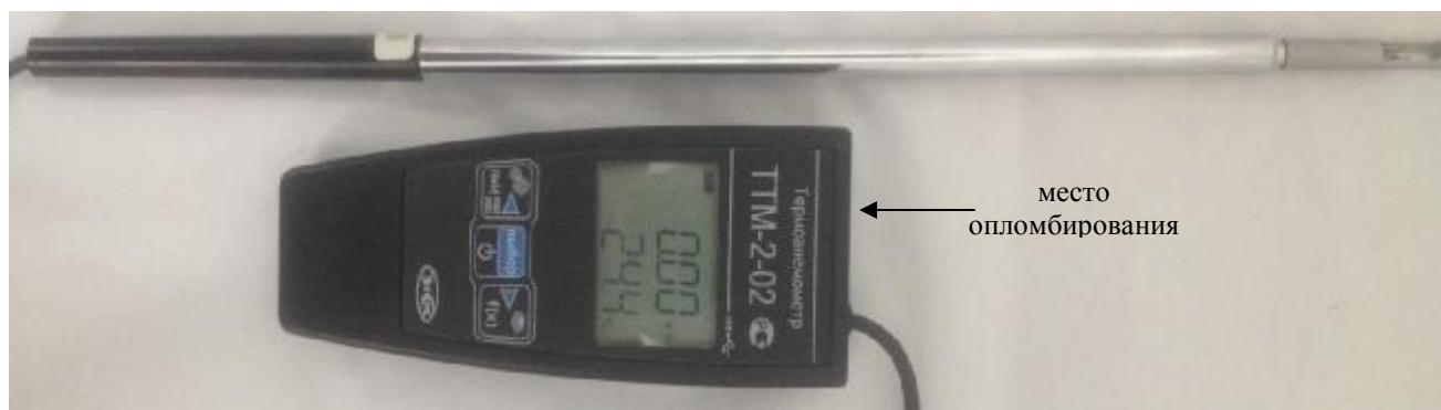
Рисунок 3. Модификация ТТМ-2-02