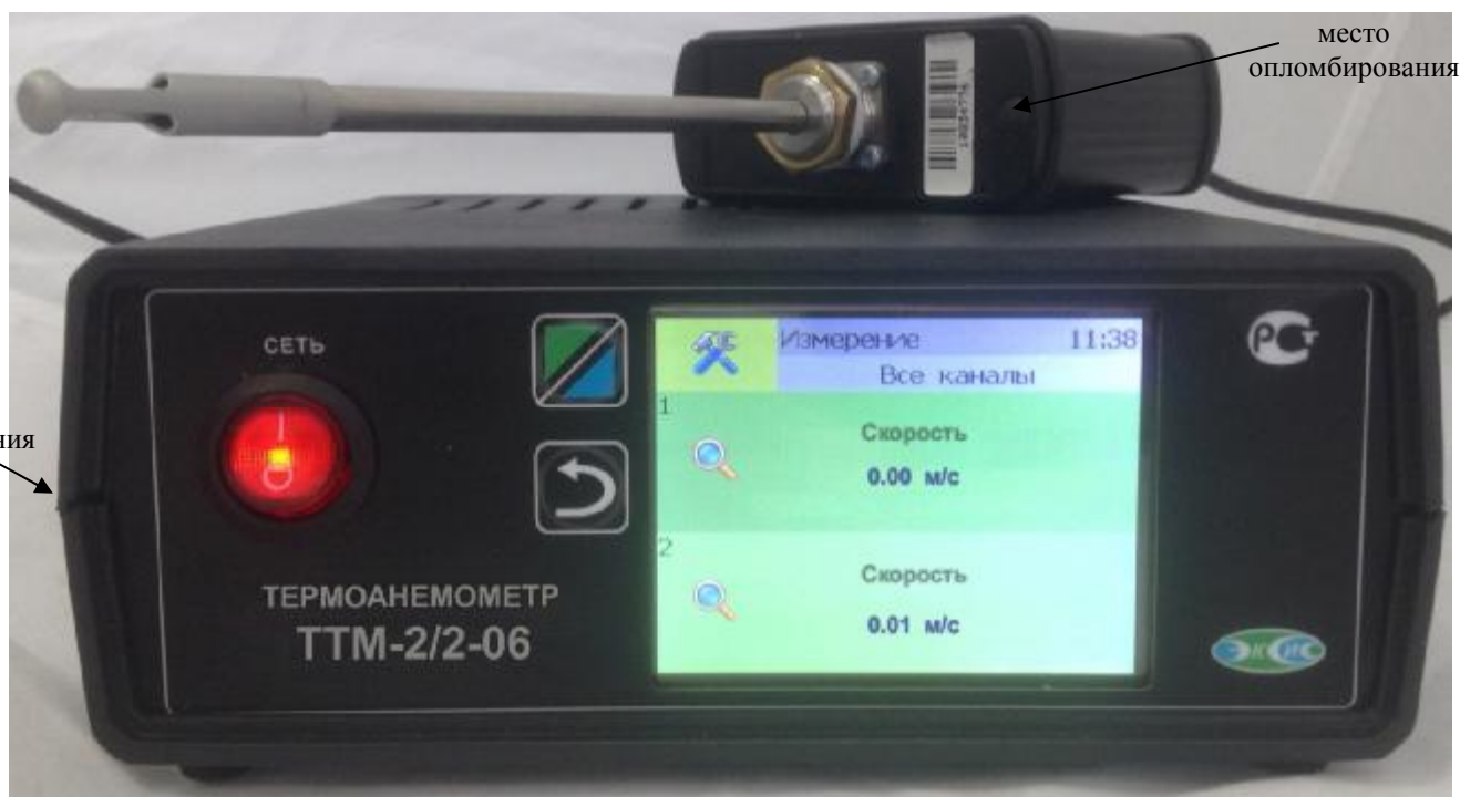
Рисунок 9. Модификация ТТМ-2/Х-06, исполнение ТТМ-2/2-06 Т