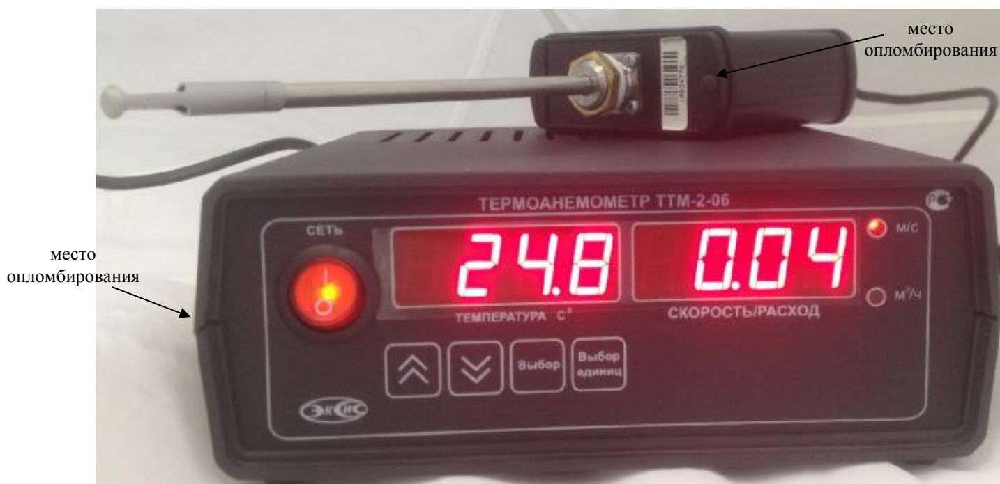
Рисунок 8. Модификация ТТМ-2/Х-06, исполнение ТТМ-2/1-06