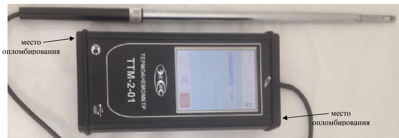
Рисунок 2. Модификация ТТМ-2-01, исполнение ТТМ-2-01 Т